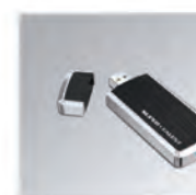
Mulighet for lagring v