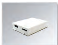
Innebygget Li-ion batteri