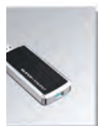
Lagring via USB